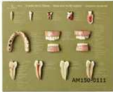
AM150-0111 Sada zubů „Udržuj chrup zdravý“ – zuby ve skutečné velikosti, zvětšené modely ukazují kazy, 12ks na podložce