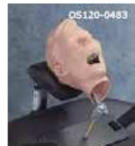
OS120-0483 Pediatrický RTG dentální manekýn – model pro nácvik provádění RTG snímků, obsahuje kombinaci zubů mléčných a druhých zubů pro nácvik správných technik pediatrické radiografie, model obsahuje mechanismus upevnění na zubolékařské křeslo