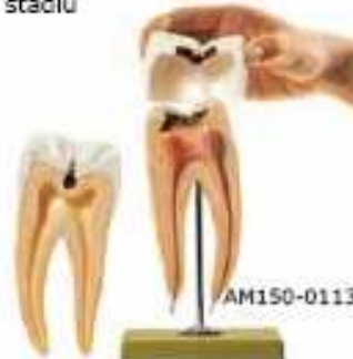
AM150-0113 Stolička, 8x zvětšeno, 3 díly, na stojanu – znázorněn zubní kaz v počátečním a pokročilém stadiu