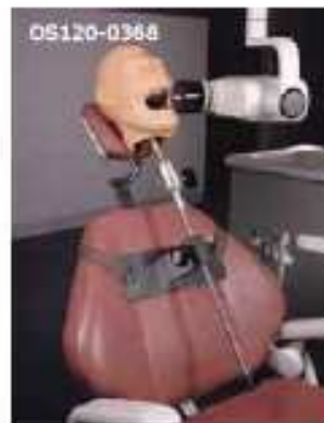
OS120-0368 RTG dentální manekýn – model pro nácvik provádění RTG snímků, obsahuje kovový chrup s pružným prstem pro držení filmu, model obsahuje mechanismus upevnění na zubolékařské křeslo