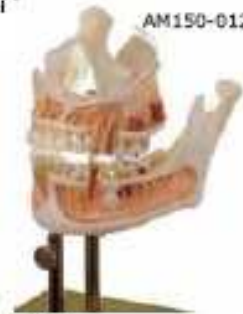
AM150-0121 Horní a dolní čelist, 2 díly, s nervy a cévami, s hlavními zubními kazy