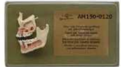
AM150-0120 Polovina horní a dolní čelisti, skutečná velikost, s nervy a cévami, s hlavními zubními