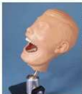
OS120-0369 Dentální manekýn – jednoduchý a ekonomický model pro výuku asistentek a sester v zubní ordinaci; model obsahuje mechanismus upevnění na zubolékařské křeslo