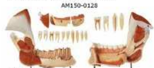
AM150-0128 Pravá dolní polovina čelisti se svaly a vyjimatelnými zuby, 3x zvětšeno, 14 dílů