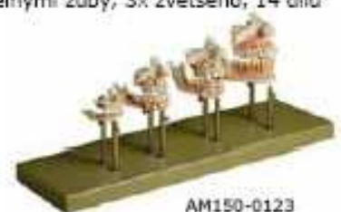
AM150-0123 Vývoj chrupu, skutečná velikost horní a dolní čelisti novorozence, 5ti letého dítěte, 9ti letého dítěte a dospělého