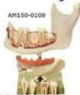
AM150-0109 Polovina dolní čelisti 18ti letého člověka, 3x zvětšeno, 6 dílů – levá polovina, oddělitelná část kosti kryjící kořeny, špičák a první stolička vyjimatelná, druhá stolička s kazem