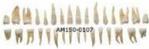
AM150-0107 Sada zubů dospělého, skutečná velikost, 32 ks