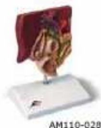
AM110-0287 Model žlučového kamene, kameny jsou umístěny: v oblasti fundu žlučníku; v oblasti spirálové chlopně; v oblasti běžného žlučovodu; v bradavkovitém otvoru k tenkému střevu