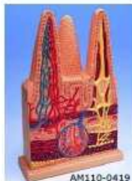
AM110-0419 Střevní klíky, 100x zvětšeno, průřez – znázorněn jeden celý klik, jeden v řezu s tepenkami a žilkami a jeden v řezu lymfatickými cévami, zvětšená ukázka podélně rozříznuté části Lieberkuhnovy krypty