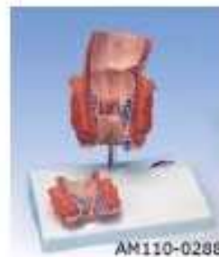
AM110-0288 Model hemoroidů, skutečná velikost frontální části konečníku, stádia I, II, III a IV