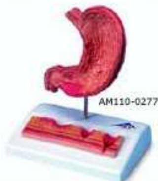
AM110-0277 Žaludek s vředy – tento patologický model demonstruje různé stupně gastritidy od lehkého gastrického vředu až po perforaci. Žaludek s jícnem a dvanácterníkem znázorňuje: zarudlou gastritidu – erozivní gastritidu – krvácející gastritidu – stav hojení se vznikající jizvou – atropická gastritida – hypertropická gastritida – krvácející vřed – perforovaný vřed, dodatečný reliéfní model znázorňuje zdravou hlenovitou membránu – akutní gastritidu v dutině – erozivní gastritidu s vadnou hlenovitou membránou – krvácející vřed – perforovaný vřed; na podstavci