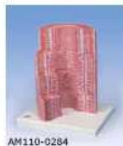
AM110-0284 Model struktury jemné tkáně 4 charakteristických částí trávicí soustavy: jícnu, žaludku, tenkého a tlustého střeva