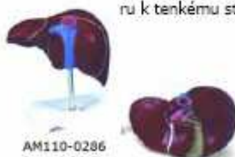
AM110-0286 Játra a žlučník – čtyři jaterní laloky, žlučník, mimojaterní žlučivod, cévy; na stojanu