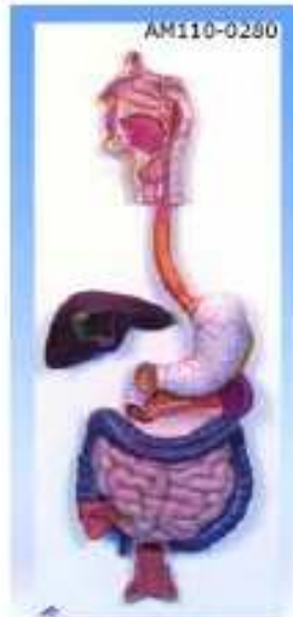
AM110-0280 Trávicí soustava, 3 díly, reliéfní model – znázorněn nos, dutina ústní s hltanem, jícen, trávicí trakt, játra se žlučníkem, slinivka a slezina. Dvanácterník, slepé střevo a konečník jsou otevřené, příčný tračník a přední žaludeční stěna lze vyjmát; na podstavci