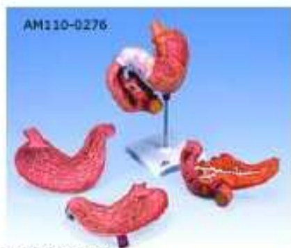
AM110-0276 Žaludek AM110-0275 s dvanácterníkem a slinivkou, 3 díly