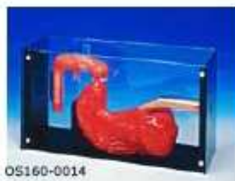
OS160-0014 Model jícnu – pro nácvik použití různých fibroskopů v jícnu, žaludku, dvanácterníku. Realistické a přesné zpracování ranné rakoviny, vředu gastrického a vředu na dvanácterníku.