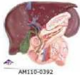
AM110-0392 Játra, žlučník, dvanácterník a slinivka – plastický reliéfní model se znázorněním i cév, mimojaterního žlučovodu se žlučníkem, vývodu slinivky břišní a jejich otvorů; na podkladové desce