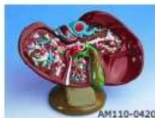
AM110-0420 Játra se žlučníkem, 1,5x zvětšeno, průřez – luxusní provedení, barevně odlišen celý cévní systém v otevřených játrech, cévy, mimojaterní a vnitrojaterní žlučivod a žlučník; na stojanu