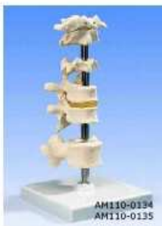
AM110-0134 Sada 6ti obratlů, na stojanu – model se skládá z atlasu, čepovce, dalších krčních obratlů, dvou hrudních obratlů s meziobratlovou destičkou a jednoho bederního obratle; na stojanu, lze sejmout