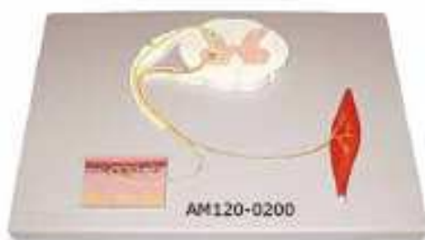
AM120-0200 Reliéfní model smyslových, nervových a motorických elementů somatického reflexního oblouku