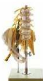
AM150-0420 Bederní páteř s nervy, 2 díly, na stojanu – barevné provedení s nervy