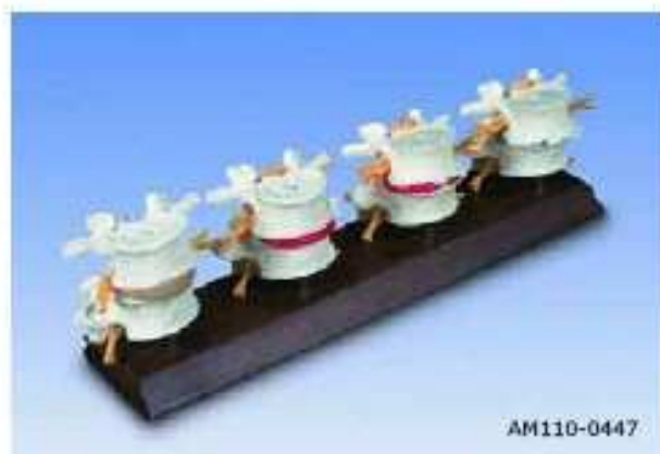
AM110-0447 Degenerace obratlů a destiček, 4 stádia