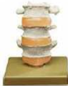
AM150-0409 Tři bederní obratle s destičkami, na stojanu, oddělitelné