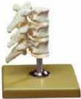
AM150-0408 Tři dorsální obratle s destičkami