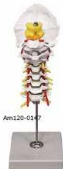
AM120-0147 Model krční páteře – sedm krčních obratlů, na stojanu