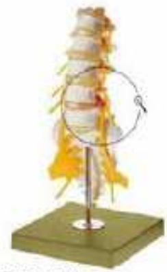
AM150-0418 Bederní páteř, na stojanu – s míchou a nervovým zakončením, dorsolaterální destička vyřezaná