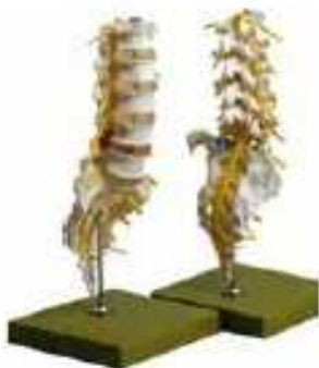
AM150-0419 Bederní páteř, na stojanu – jako AM150-0418, se spondylolýstézou