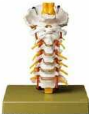
AM150-0414 Krkční páteř, na stojanu – pružné provedení, s míchou a nervovým zakončením, laminek-tomie na C4