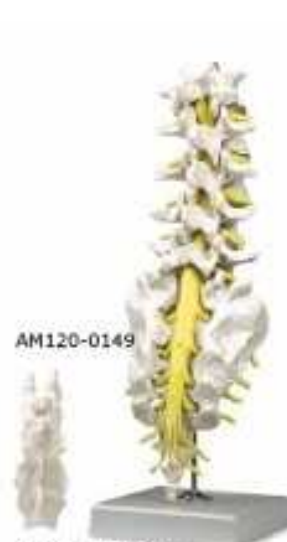
AM120-0149 Model pěti bederních obratlů, odnímatelná kostrč