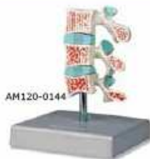
AM120-0144 Model tři obratlů – zdravý obratel, obratel s patologickými změnami prvního stádia a obratel s patologickými změnami pokročilého stádia, na stojanu