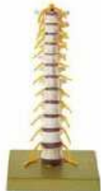
AM150-0412 Hrudní páteř, na stojanu – pružné provedení, s míchou a nervovým zakončením