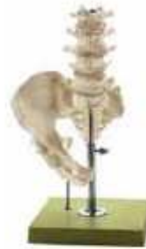
AM150-0421 Bederní páteř bez nervů, 2 díly – na stojanu, degenerativní mutace pánevních kostí a bederní páteře se zobrazením nejdůležitějších poruch