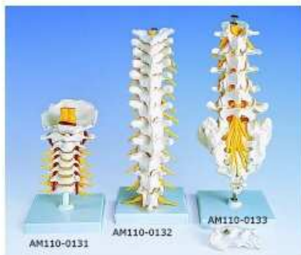
AM110-0131 Krční páteř, 5 dílů – týlová kost, sedm krčních obratlů s meziobratlovými destičkami, vertebrálními tepnami a míchou; páteř je pohyblivá; na stojanu