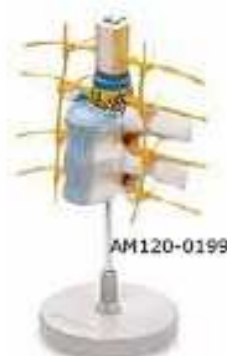
AM120-0199 Model hrudního obratle s konci žebér, demonstrace vztahu mezi hrudníkem a páteří, na podstavci