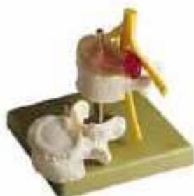
AM150-0423 Vyřeznutá dorsolaterální meziobratlová destička, 4 díly