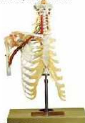
AM150-0415 Krkční páteř – s ramenem, klíční kostí a částí hrudníku, na stojanu