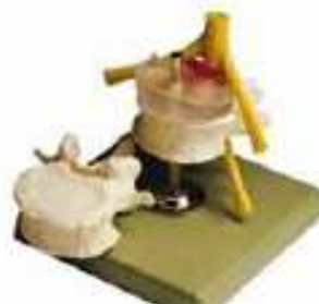
AM150-0424 Vyřeznutá centrální meziobratlová destička