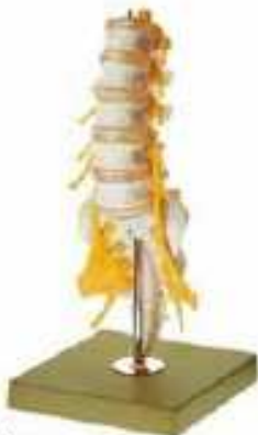
AM150-0413 Bederní páteř, na stojanu – s míchou a nervovým zakončením