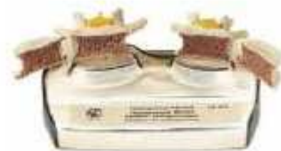
AM150-0422 Model osteoporózy, jeden zdravý obratle a druhý s osteoporózou, na stojanu