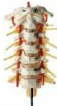
AM150-0411 Krkční páteř, na stojanu – pružné provedení, s míchou a nervovým zakončením