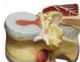
AM150-0425 První bederní obratle s meziobratlovými destičkami a dorsálními svaly