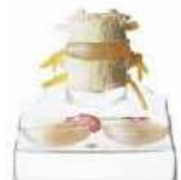
AM150-0426 Centrální a dorsolaterální výron meziobratlové destičky, 5 dílů