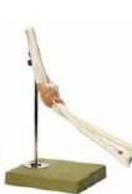
AM150-0266 Funkční model loketního kloubu