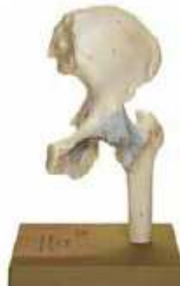
AM150-0254 Kyčelní kloub, nepohyblivý