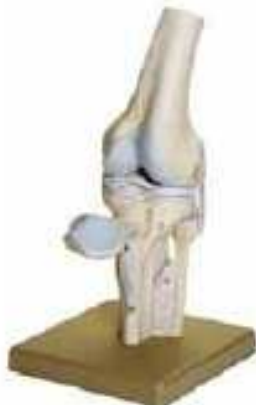
AM150-0253 Kolenní kloub, nepohyblivý