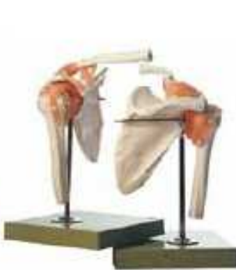
AM150-0267 Funkční model ramenního kloubu