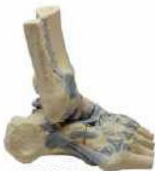
AM150-0257 Vazy kotníku, 2 díly