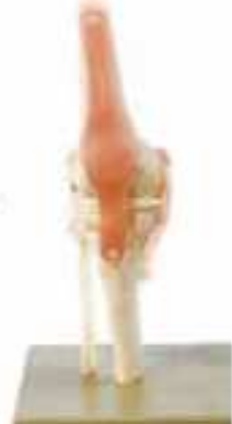
AM150-0264 Funkční model kolenního kloubu