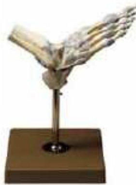
AM150-0255 Kotník, nepohyblivé