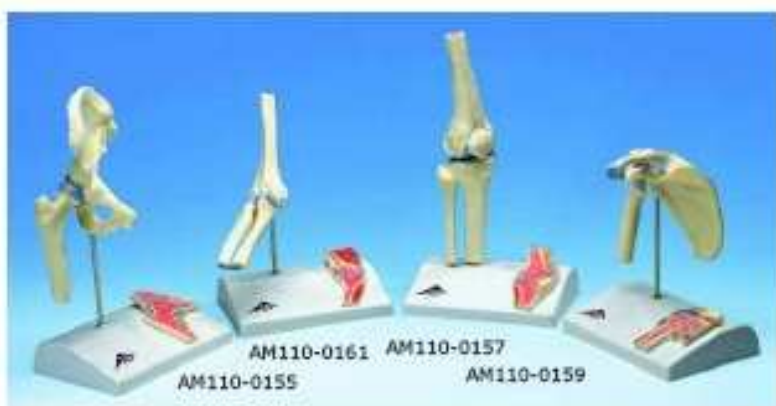
AM110-0155 AM110-0161 AM110-0157 AM110-0159

AM110-0152 Loketní kloub, na podstavci – sestává z části humeru, kompletních loketních kostí a vazů