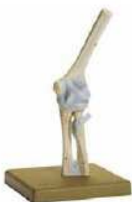
AM150-0252 Loketní kloub, nepohyblivý