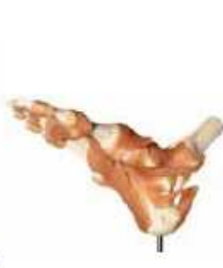
AM150-0268 Funkční model kotníku a chodidla