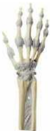
AM150-0256 Klouby ruky, nepohyblivé