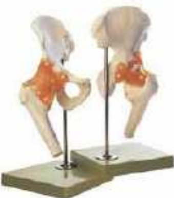
AM150-0265 Funkční model kyčelního kloubu