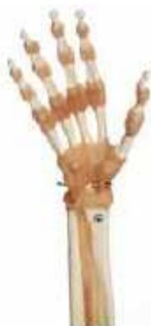
AM150-0270 Funkční model zápěstí a prstů