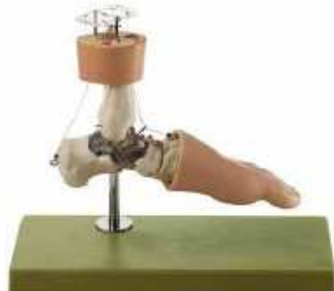
AM150-0269 Funkční model chodidla, na podstavci