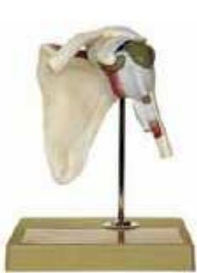
AM150-0251 Ramenní kloub, barevně odlišené komponenty, nepohyblivý